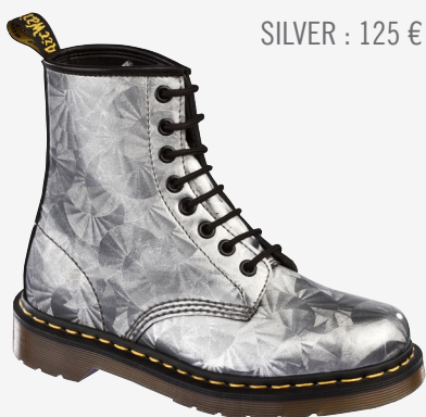
SILVER : 125 €