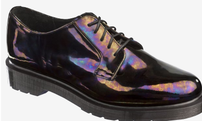
BLACK PETROL : 185 €