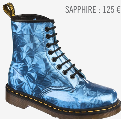
SAPPHIRE : 125 €