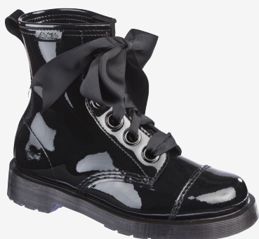
BLACK PATENT LAMPER : 150 €