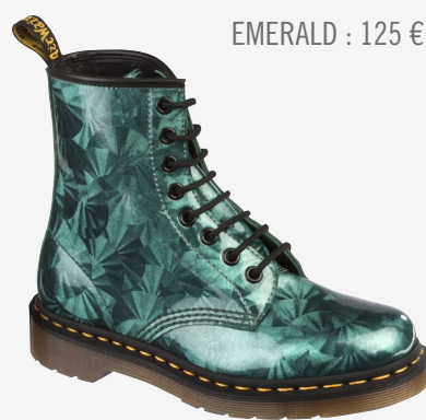
EMERALD : 125 €