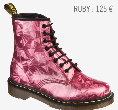
RUBY : 125 €