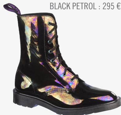
BLACK PETROL : 295 €